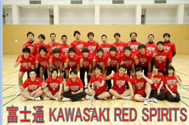
富士通 KAWASAKI RED SPIRITS